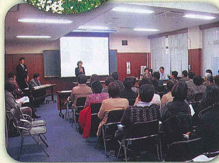
栃木市の女性会との交流