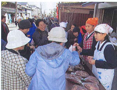
6年生 キッズ未来プロジェクト （商業体験）

本校の取組はまだスタートしたばかりです。地域と連携しながら、これらの取組を通して、大洗町の産業を理解し、地域を愛する子どもたちを育てて行きたいと考えています。そして、次の世代を担う子どもたちに、確かな学力を養うとともに、この地で仲間とともに学びあった幸せを感じ取れるような教育を推進し、大きな夢を育んでまいります。