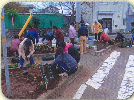
大洗町大貫女性会(ゆっくら通り)