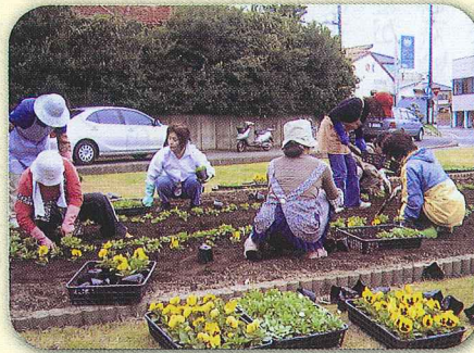
大洗町磯浜女性会(東光台ロータリー)