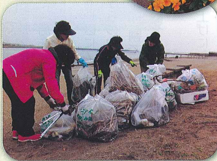
海門橋下の水辺プラザの清掃活動